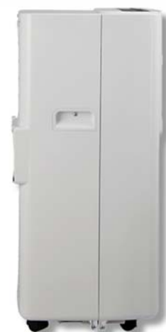
Lätt flyttbar med sidohandtag och vridbara hjul