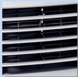
Justerbar luftriktning både horisontellt och vertikalt